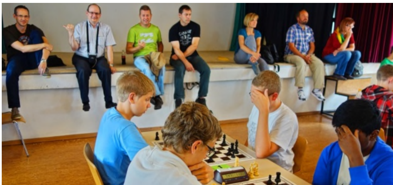
Turniersaal: Spitzenbretter U18 (Bildmitte) und Zuschauerreihe im Hintergrund.