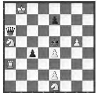
Weiss zieht und gewinnt