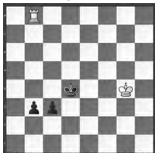
Fridstein – Lutikow Riga, 1954

Wie kann Weiss am Zug das Remis sichern?