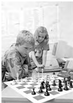
Früh übt sich, wer Weltmeister werden will.

Nach «Pawn Sacrifice» läuft ab 5. Januar mit «Magnus» ein weiterer Schachfilm in Studiokinos einiger Schweizer Grossstädte. Sicher zu sehen sein wird er in Zürich (Stüssihof und Arthouse), Bern (Quinnie-Gruppe) und Basel (Kult Kino). Welche Kinos ihn auch noch zeigen, finden Sie hier: www.cineman.ch/movie/2016/Magnus .