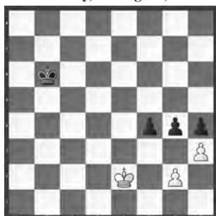
Studie von Alexander Ilyin Zhenevsky, Leningrad, 1938

Schwarz am Zug. Wie würden Sie hier fortsetzen?