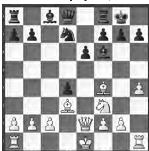
Charbonneau – Hussein Dresden Olympiade, 2008

Schwarz am Zug. Wie würden Sie hier fortsetzen?