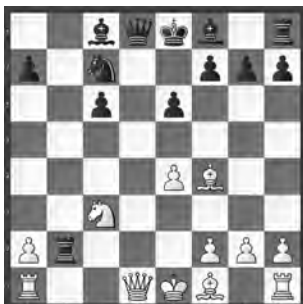
Strating – van der Schilden Haarlem, 1996

Schwarz schnappte sich gerade den Bauern auf b2. Welche Überraschung folgte?