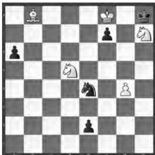
Weiss zieht und hält remis

Schwarz hat einen vor der Umwandlung stehenden Freibauern und droht, einen weissen Springer zu schlagen.