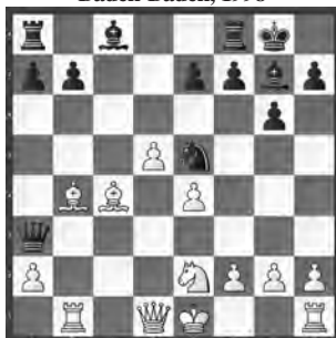
Waffenschmidt – Eidinger Baden-Baden, 1998

Die schwarze Dame scheint gefangen. Doch welchen Zug zauberte Schwarz aus dem Hut?