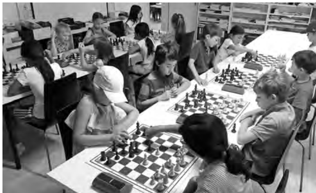
Les camps d'échecs favorisent des amitiés nouvelles ou existantes entre les enfants.