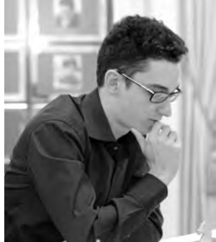
Fabiano Caruana impérial à Wijk aan Zee.

11. ... ♟xe5?! Un pari risqué, qui a donné raison aux Blancs dans les quelques parties qui ont été jouées. Après 11. ... ♖c7 12. ♟xd7 ♟xd7 13. ♟c3 b4 14. ♟f4! les Noirs ont également des problèmes, comme le démontre la partie suivante: 14. ... ♖b6 (14. ... e5 15. dxe5 bxc3? 16. e6) 15. ♟a4 ♖b5 16. ♜ac1 ♜ac8 17. ♟c3! ♖b6 18. ♟e4 c5 19. ♟d6! ♟xd6 20. ♟xd6 ♖xd6 21. ♟xb7 ♜b8 22. dxc5 ♟xc5 23. ♜xd6 ♟xb3 24. ♜c7 avec un gros avantage pour les Blancs: 1-0 (60) Petrov – Frolyanov, Yaroslavl 2019.