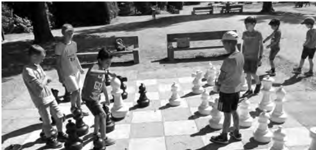
Schachcamps fördern bestehende und neue Freundschaften unter den Kindern.