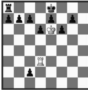
# 2 2+10