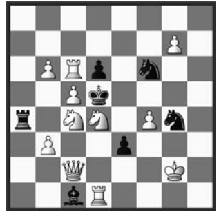
# 2 11+7