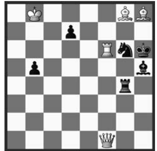
# 3 b) wD→f3 5+6