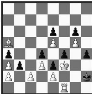
# 4 10+9