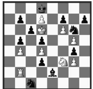
# 5 9+12