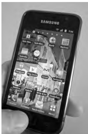
Zum siebten Mal seit 2006 beschäftigt sich das Verbandsschiedsgericht mit dem Thema «Handy».

Zweitens legte sein Captain den Fall nicht – wie das SMM/SGM-Reglement in Artikel 44.3. für Streitfälle vorsieht – formge-