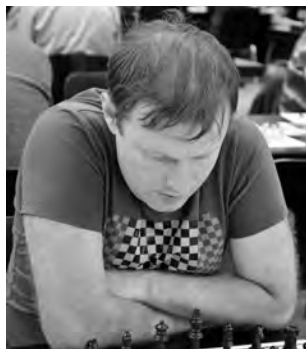
Wiederholte zwischendurch immer wieder die Züge, um Bedenkzeit zu gewinnen: GM Sergej Owsejewitsch.

34. ... ♚b1+ 35. ♘h2 ♘g8 36. ♚e4! Ein Problemzug! Weiss unterbricht die Diagonale b1–h7 und droht Matt. Schwarz muss nun seine Dame geben. Er erhält jedoch viel Material dafür.