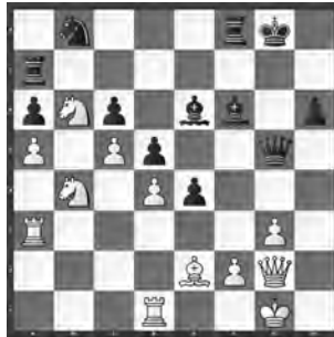
Lötscher – Vernay Luzern – Genf

Mit welcher starken Überraschung wartete Schwarz hier auf?