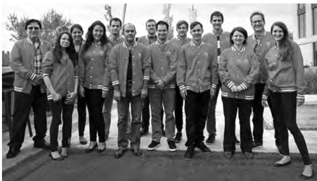
Die Schweizer Delegation durfte mit dem Abschneiden an der Olympiade in Baku zufrieden sein.

49. ... g6. Ab hier fing ich an, ungenau zu spielen und direkte Gewinnwege zu verpassen. Ich rechnete hier 49. ... ♗f5! 50. ♖b8+ ♗h7 51. ♖d5, fand aber nichts Klares, da Weiss auch