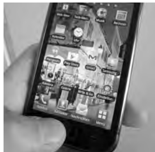
Pour la 7e fois depuis 2006, le Tribunal arbitral est confronté à une affaire de natel.

► Deuxième faute: Que le recours de la section concernée soit considéré comme irrecevable, cela est également dû au fait que la procédure officielle n'a pas été respectée, indique le jugement écrit du TA. Aucun jugement de la direction du CSE n'a