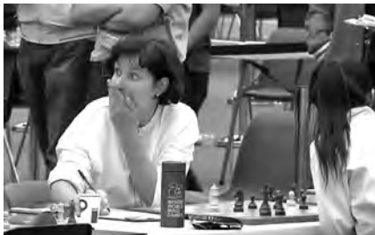
Dana Reizniece-Ozola, Ministre des Finances de Lettonie, n'en revient pas d'avoir battu la championne du monde Hou Yifan (voir page 18).

Un très joli coup. La position noire s'écroule. Après 30. ♗xa4