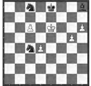
1108 Wladimir Naef «Schweizerische Schachzeitung», 1949

Nachfolgend zwei weitere Studien von Wladimir Naef zum Selberlösen: