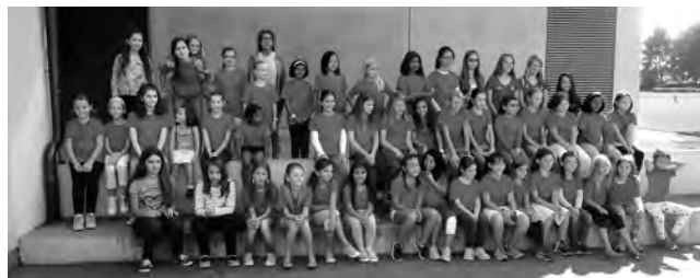
Die 48 Teilnehmerinnen der Schweizerischen Mädchen-Schnellschachmeisterschaft in Zollikon.