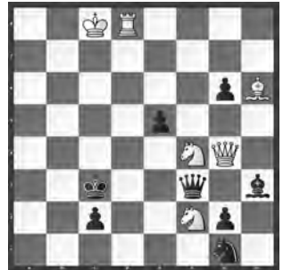
H # 2 b) ♘f2→b2