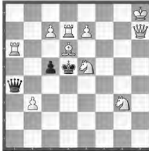
15121 Valerij Schanschin Ekaterinburg (RU)

15114 B. Kozdon. 1. ♗g8! (2. ♖a2 ♗e8 3. ♗h7+! ♖g5 4. ♗f5+) ♗h3+ («ein Racheschach, sonst gehts schneller» [PNJ]) 2. ♖b2! (2. ♖a2? ♗h5! 3. ?) ♗h5 3. ♖a2! (Zzw.) ♗e8 4. ♗h7+ ♖g5 5. ♗f5+ ♖h6 6. ♗f6+ ♖h5(♗g6) 7. ♗d1(♗xg6). – «Fortsetzung der unendlichen Geschichte der Miniaturen mit s♗» (JB). Martin Hoffmann