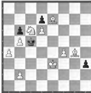
15123 Petrašin Petrašinović Belgrad (SB)