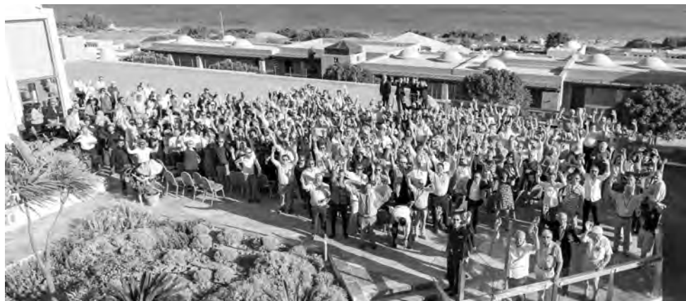
Auch die ACO-Amateur-Weltmeisterschaft 2018 findet wieder auf Kos statt.