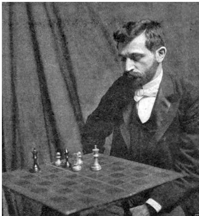
Der Schachklub Young Lasker wurde nach dem jüdischen Schachweltmeister Emanuel Lasker benannt. (Zeichnung zu einer Lasker-Simultanvorstellung in Bern 1919 von Christian Brunnenschweiler)

Im Jahre 1921 lebten rund 7000 Jüdinnen und Juden in Zürich. Neben den drei Gemeinden («Israelitische Cultusgemeinde Zürich»/«Israelitische Religionsgesellschaft»/«Agudas Achim»), welche die verschiedenen Glaubensrichtungen der Eingesessenen und der Zugewanderten repräsentierten, existierten nicht weniger als 24 Vereine oder Institutionen, die ihren Beitrag zum Bestand der jüdischen Kultur und des jüdischen Lebens in Zürich leisteten.