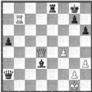
Schweighoffer – Jenni SEM 2017, Nationalturnier

Weiss droht Matt! Wie sichern Sie mit Schwarz das Remis?