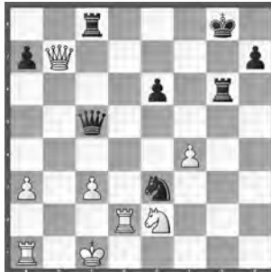
Huss – Schweighoffer SEM 2017, Nationalturnier

Schwarz ist klar am Drücker. Wie setzen Sie hier kräftig fort?