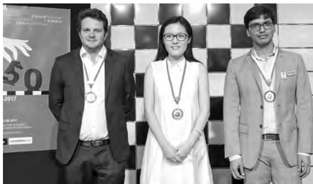
Le podium du tournoi de Grands Maîtres (de gauche à droite): Etienne Bacrot (2 e), Yifan Hou (1 er), Pental Harikrishna (3 e).