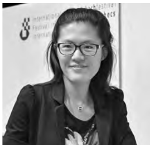
Gewinn als Startnummer 7 überraschend das Bieler Grossmeisterturnier: die chinesische Ex-Weltmeisterin Yifan Hou.

ich eine leicht bessere Stellung, bevor ich zwei fehlerhafte Züge machte. Trotzdem war Biel für mich natürlich ein fantastisches Turnier. Ich hätte mir nie erträumt, dass ich gegen soviel starke Gegner 5 Punkte holen würde. Dass ich kurz vor dem Turnier Grossmeister geworden bin, war zweifellos ein wesentlicher Grund für meinen guten Lauf. Denn damit war der ganze Druck weg, und ich konnte befreit aufspielen.»