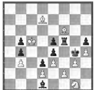
15126 Anton Baumann Luzern (Neufassung Nr.14106 von Levs Ulanovs)