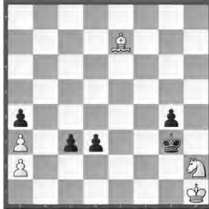
Weiss zieht und hält remis

Ein Kampf gegen die beiden verbundenen schwarzen Freibauern. 1. ♜g5? verliert, nicht wegen 1. ... d2? 2. ♜xd2 cxd2 3. ♖f1+ mit Remis, sondern wegen 1. ... ♗f2! 2. ♜xg4+ ♜e2 3. ♜g2 d2 4. ♜e3 c2.