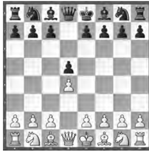
Dorénavant, une proposition de nul ne peut être faite qu'après le premier coup des noirs.

► Propositions de nul: Une proposition de nul ne peut être faite qu'après le premier coup des noirs (!). Convenir d'un nul sans qu'un coup ait été effectué n'est pas autorisé.