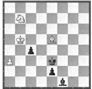
Weiss zieht und hält remis