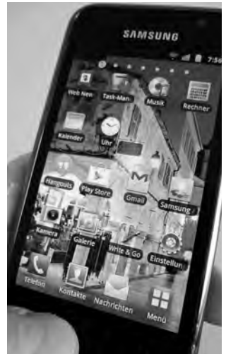
Concernant l'utilisation d'appareils électroniques, l'arbitre dispose de davantage de compétences et peut concéder des exceptions.

Matthias Gallus/Beat Rügsegger/Georg Kradolfer/Traduction: Bernard Bovigny