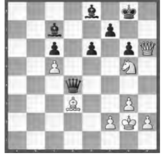
Pelletier – Hommes SMM 2017, Zürich – Bodan

Mit welchem Zug zwingt Weiss seinen Gegner zur sofortigen Aufgabe?