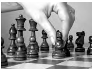
Nur der Spieler, der am Zug ist, darf eine oder mehrere Figuren auf ihren Feldern zurechtrücken.

► Berührt – geführt: Hier wird eine Verschärfung angestrebt. Nur der Spieler, der am Zug ist, darf eine oder mehrere Figuren auf ihren Feldern zurechtrücken – vorausgesetzt, dass er seine Absicht im Voraus bekannt gibt. Wer eine