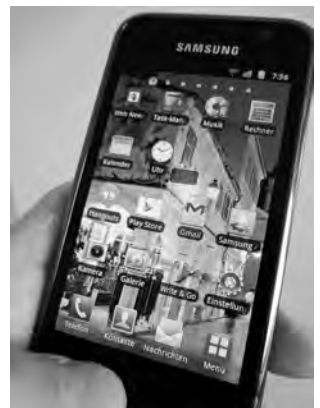
Bezüglich des Gebrauchs von elektronischen Geräten erhält der Schiedsrichter mehr Kompetenzen und kann Ausnahmen bewilligen.