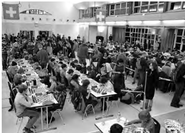
In den Qualifikationsturnieren zur Schweizer Meisterschaft U10 ist ungefähr ein Drittel aller Teilnehmer acht Jahre oder jünger.

Am Sonntag, 10. Dezember, findet im Haus des Sports in Ittigen die erste Schweizer Meisterschaft U8 statt. Gespielt werden zwischen 10 und 17 Uhr sieben Runden à 10 Minuten plus 10 Sekunden pro Zug. Der Einsatz beträgt 20 Franken. Für die drei Erstplatzierten gibt es einen Pokal. Alle Teilnehmer(innen) bekommen