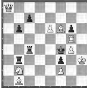
15229 Christian Styger Flurlingen

15222 K. Keller. 1. e6? ♖h1 2. ♖g7!; 1. ... ♖xf1! – 1. c6! (Zzw.) ♖xf1 2. ♖f3+ ♖xd1 3. c5 (4. ♖a4) ♖xd3 4. ♖xd3 (1. ... ♖xe4 2. dxe4) 1. ... ♖h1 2. ♖b3+ ♖e2 3. ♖c2 ~ 4. ♖c1. Ein weisser ♖-Kegel mit überraschendem Spiel. – «Sehr interessante Aufgabe, wie kommt die ♖ aus dem 8 ♖ starken Käfig?» (JM). – «Kegeln auf engstem Raum mit eingesperrter w♖» (JB).