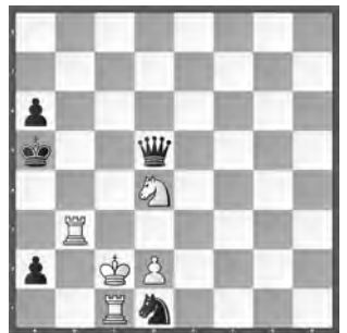
Weiss zieht und gewinnt

Lösungen mit Kommentaren bis 15. Oktober per E-Mail an roland.ot@swissch.ch