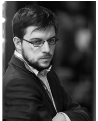
Maxime Vachier-Lagrave: «Ma saison 2019 était une des meilleures du circuit et en toute logique aurait dû me rapporter une qualification aux Candidats.»

Il est difficile pour moi de faire des prédictions pour la suite du tournoi et j'attends donc sagement d'avoir un horizon de reprise. Ma seule priorité est d'arriver prêt le jour J, et par chance je pense que nous aurons des indices assez sérieux de reprise