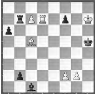
Weiss zieht und hält remis

Die sofortige Umwandlung des weissen Freibauers würde mit der Umwandlung des schwarzen Freibauers mit gleichzeitigem Schachgebot beantwortet. Deshalb opfert Weiss zuerst einen Bauern, um den schwarzen König in die Schusslinie der damit gebauten Dame/Turm-Batterie zu lenken.