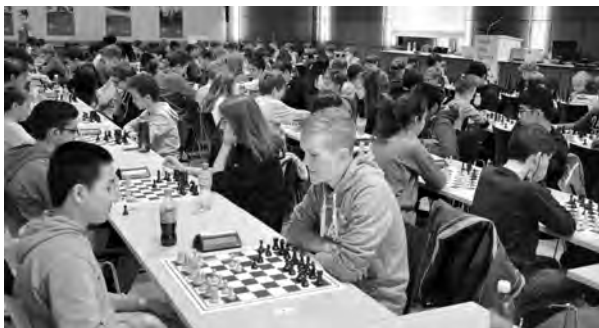
Parmi les nombreux projets soutenus par le Fonds figurent plusieurs tournois juniors.

24. Le nombre est assez constant depuis plusieurs années car nous avons heureusement des donateurs fidèles. Mais il y a encore du potentiel et nous serions heureux d'accueillir de nouveaux donateurs. En particulier, le Fonds pour les échecs juniors n'est pas encore suffisamment ancré en Romandie et au Tessin. Nous avons peu de donateurs dans ces deux régions, mais également peu de demandes de soutiens pour des tournois au Tessin. Mon but est donc de renforcer nos activités en Romandie et au Tessin, autant par