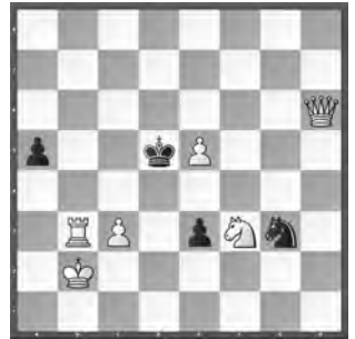
15232 Petrašin Petrašinović Belgrad (Srb)