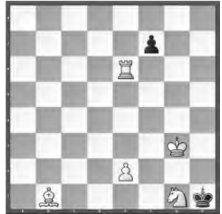
2 Axel Åkerblom Svenska Dagbladet 1925