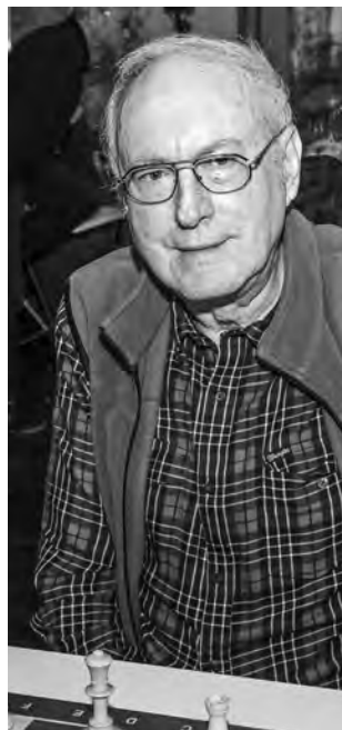
Über Hermann Singeizens 27. Zug staunte selbst die Engine.

Schwarz opfert einen unwichtigen Bauern und hat dafür seine Springer aktiver gestellt.