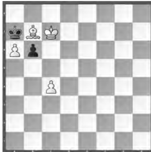
15233 Valerij Surkov Moskau (Rus)