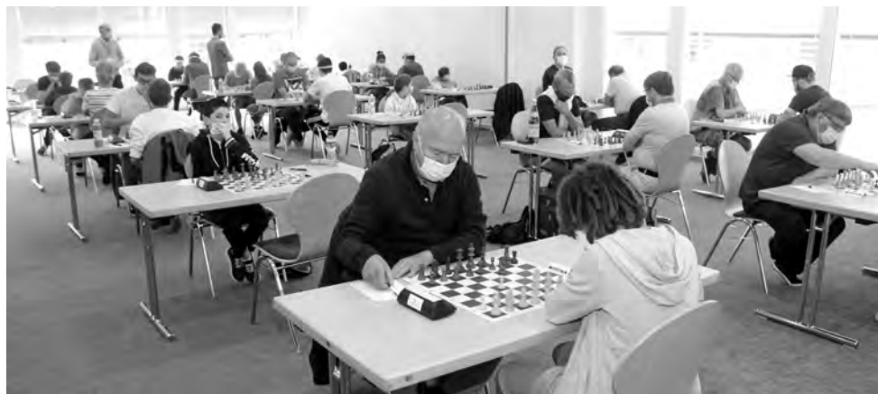
Die 57 Teilnehmer mussten sich an strenge Schutzvorkehrungen halten – so insbesondere an die Maskenpflicht.