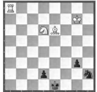
Weiss zieht und gewinnt