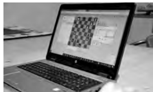
Am 22./23. und 29./30. August findet die 1. Schweizer Online-Meisterschaft im Blitz- und Rapidschach statt.

Das Blitzturnier findet am 22./23. August (mit Start am