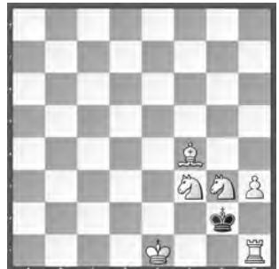
6 Karl Fabel New Statesman 1963