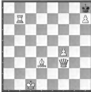
1 Ado Kraemer Deutsche Schachzeitung 1936