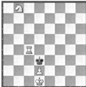
5 Werner Keym Der Stern 1998