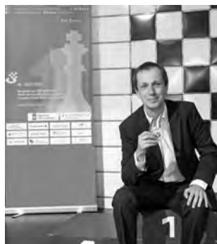
Gewann in Biel das weltweit erste Einladungsturnier an Brettern seit dem Lockdown: GM Radoslaw Wojtaszek.

Einen Favoritensieg gab es im Corona-Hauptturnier (133 Teilnehmer). Der topgesetzte französische Grossmeister Christian Bauer (43) gewann mit 8 aus 9 und einem halben Punkt Vorsprung auf die beiden Deutschen FM Frank Buchenau (Nr. 12) und IM Gerlef Meins (Nr. 4). Als bes-