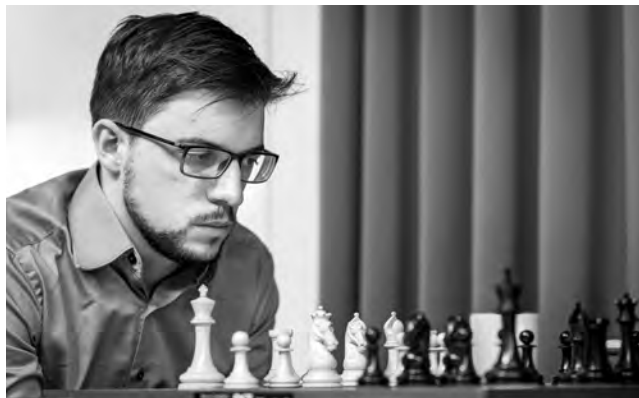
Maxime Vachier-Lagrave: «Il est difficile pour moi de faire des prédictions pour la suite du tournoi et j'attends donc sagement d'avoir un horizon de reprise.»

manière très efficace. Quel est le rôle d'un agent d'un joueur du top niveau?