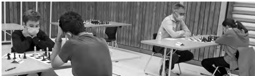
Das Acrevis-Amateur-Open in Wil/SG ging unter besonderen Schutzbestimmungen über die Bühne.