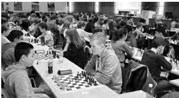
Neben vielen anderen Projekten unterstützt die Jugendschachstiftung auch Turniere für Jugendliche.

24. Die Zahl ist seit Jahren ziemlich konstant, denn wir haben erfreulicherweise treue Donatoren. Andererseits haben wir durchaus Luft nach oben und würden uns sehr über neue Donatoren freuen. Insbesondere in der Romandie und im Tessin ist die Jugendschachstiftung leider noch nicht so stark verwurzelt. Wir haben aus diesen beiden Regionen nur wenige Donatoren, aus dem Tessin haben wir auch wenige Anfragen für die Unterstützung von Turnieren. Mein Ziel ist es deshalb, unsere Aktivitäten in der Romandie und im Tessin – sprich