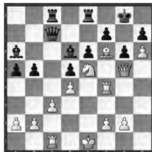
Peng – Kurmann Wollishofen – Luzern

Zum Schluss werden Sie nochmals richtig gefordert. Finden Sie für Weiss hier den Gewinnweg!