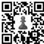
Dieser QR-Code führt Sie zum Chess.com-Club des SSB.