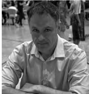
Der topgesetzte französische Grossmeister Christian Bauer gewann das Hauptturnier I überlegen mit 6½ aus 7.

22. h4 ♖f7. Eine für beide Seiten schwierig zu spielende Stellung. Die Engine schlägt hier Züge wie