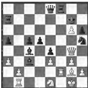
Deubelbeiss – De Kalbermatten Bundesturnier 2016, HT I

Suchen Sie Kandidatenzüge. Welches ist der beste Zug für Weiss?