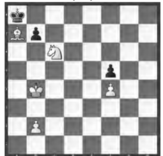
15072 Anatolij Karamanits und Wladimir Samilo Charkiv / Dnjepropetrovsk (UA)