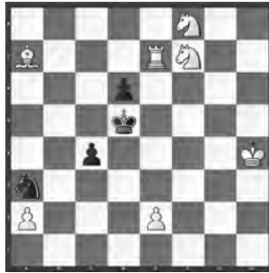
15069 Petrašin Petrašinović Belgrad (SB)