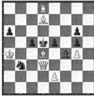
15067 Hannes Baumann Zürich

15060 B. Kozdon. 1. ♖f1! (Zzw.) ♖h6 2. ♚b2! (3. ♚h2) ♖xf7! (2. ... ♖h7? 3. ♚h2+ ♖h6 4. f8 ♚+ ♖h8 5. ♚xh6) 3. ♚h2+ ♖h5 4. f7! ♖xh2 5. f8 ♖+ ♖h5/♖h7 6. ♖h8/♖g7. Nicht 1. ♚a7? ♖h6 2. ♚a1 ♖c5? 3. ♚h1+ ♖h5 4. ♚xh5+ ♖xh5 5. f8 ♖; 1. ... ♖xf7! – «Der präzise Schlüssel verhindert s Gegenschachs und ermöglicht so schliesslich überraschend die Umwandlung des hinteren weissen f-Bauern» (RO). «Logischer Entfernungsschlüssel» (PN). «Wieder eine Miniatur mit s ♖! Der w ♖ zieht zunächst auf ein sicheres Feld, der w Opfer-♚ kann schliesslich durch eine neu erwandelte w ♖ vorteilhaft ersetzt werden!» (JB).