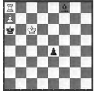
Schwarz am Zuge, Weiss gewinnt