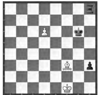
Weiss zieht und hält remis

Lösungen mit Kommentaren bis 5. Juli 2016 per E-Mail an roland.ott@swisschess.ch