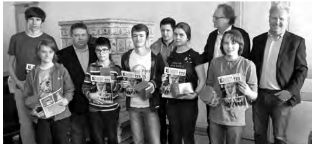
L'équipe d'Allemagne est remontée de la 3 e à la 1 re place grâce aux parties rapides.

22. ... ♙xf5+ 23. ♘de4 ♘xe4. 23. ... ♙g8 24. ♙e2 ♙h4! 25. f3 ♙h6 26. ♙f2 ♙xh3 27. ♙h1 (27. ♙xc5 ♘xc5 28. ♙h1 ♙xe4+ 29. ♘xe4 ♙f5 30. ♙xh6 ♘xe4 31. ♙d3 ♘xf2 32. ♙xf5