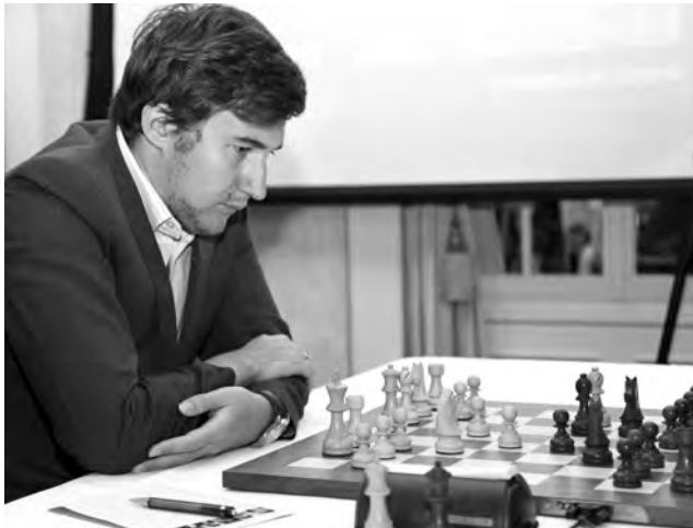
Sergey Karjakin a créé une surprise en emportant le tournoi.

21. ... ♖xc1? Un échange logique d'une certaine façon, mais qui rendra le jeu blanc trop facile. 21. ... ♙g6 était souhaitable: 22. ♙e3 ♖xe4 23. ♖bd1 ♙f6 24. ♙d3 ♖e7 25. ♙xg6 hxg6 et la position est presque égale. 21. ... f5 était également intéressant