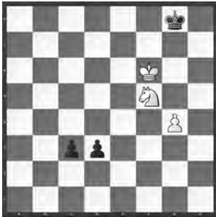
Weiss zieht und gewinnt

Der schwarze König ist weit von seinem Freibauernpaar entfernt. Um zu gewinnen, benötigt Weiss natürlich seinen eigenen Freibauern.