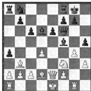
Moret – Perruchoud Bundesturnier 2016, Senioren I

Je ein Läufer ist angegriffen. Weiss am stärksten? Zug. Was ist am stärksten?