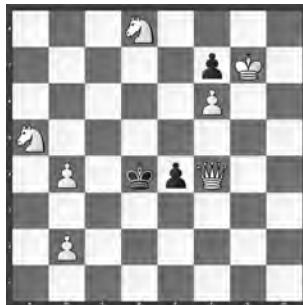
15071 Petrašin Petrašinović Belgrad (SB)