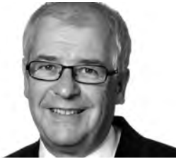
Ständeratspräsident Hans Altherr: «Schach bietet keine grosse Abwechslung zur Politik.»

«Mein Interesse an dem, was im Schachgeschehen läuft, ist