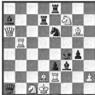
3 Jacobus Haring Main-Post 1965 1. Preis ex aequo