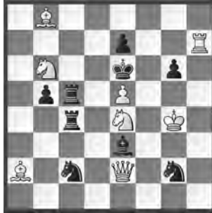
14899 Herbert Ahues Bremen (D)

14892 O. Schmitt (mit sSSg6 und g8!). 1. Sd5? Ld8 2. Sb6+ Lxb6 3. axb6 Txb2, bzw. 2. Tg3? S6e7! 1. Tg3? Txc3? 2. Sd5; 1. ... Txb2! – 1. Sb5! (2. Sa7) Kd7 2. Sbd4+ Kc8 3. Sc6 Kd7 4. Scd8+ Kc8 5. Tg3! (3. Txc3) Txc3 6. Sc6 Kd7 7. Scd4+ Kc8 8. Sb5 Kd7 9. Sbc7+ Kc8 10. Sd5 Ld8 11. Sb6+ Lxb6 12. axb6 ~ 13. b7 (Modellmatt). Switchback of the Sc7 in logical combination (Autor). Martin Hoffmann