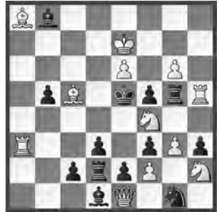
2 Jaques Fulpius (†) diagrammes 1987 Spezielle ehrende Erwähnung