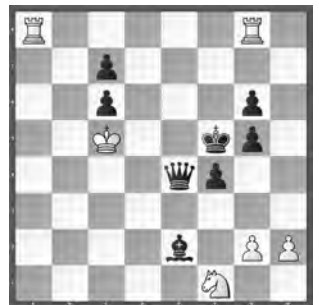
Weiss zieht und hält remis

Lösungen mit Kommentaren bis 1. August per E-Mail an roland.ott@swisschess.ch Brian Stephenson/Roland Ott