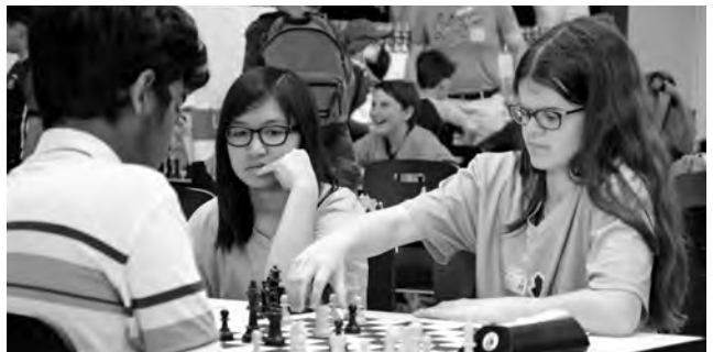
Kiebitzen am Nebentisch ist erlaubt, Tipps an die Teamkollegin geben, natürlich nicht.