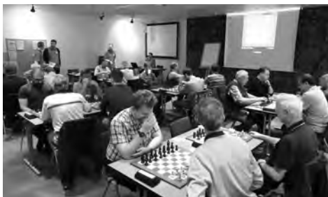
Bereits zum 11. Mal organisierte der Fischerschach-Verein dieses Jahr sein Chess960-Turnier.