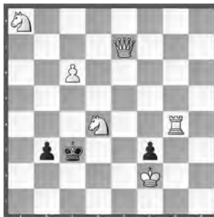
15153 Petrašin Petrašinović Belgrad (SB)