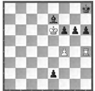
Weiss zieht und hält remis