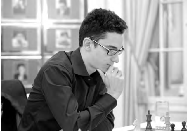
Fabiano Caruana a gagné le tournoi des Candidats.

► Alexander Grischuk (6½ points): rock'n'roll! En plus d'un résultat surprenant, ayant été proche de la tête du tournoi avant de «craquer» en fin de parcours, il aura sans doute été la personnalité préférée du public. Le russe semblait détendu, et a beaucoup amusé la foule avec des réponses