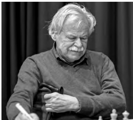
War als Sechster bester Senior: GM Vlastimil Hort.