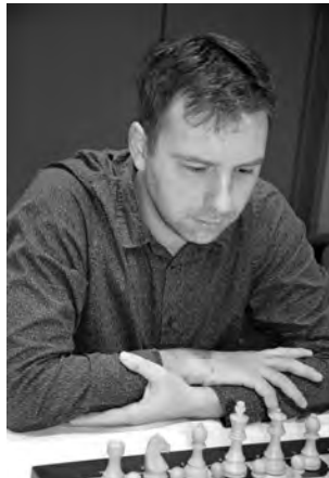
Als Startnummer 5 gewann der deutsche Grossmeister Vitaly Kunin erstmals das Meisterturnier im Hotel «Crown Plaza».

12. ... h6?! Mit Blick auf den Partieverlauf ein Zeitverlust. Direkt 12. ... ♙f6 13. ♙xf6 ♙xf6 14. ♙xd6 cxd6 15. ♜e4 ♙e7 mit Ausgleich war besser. Falls nun 16. ♜xd6?!, dann ist 16. ... ♜fd8 gut für Schwarz, da der weissfeldrige Läufer noch nicht entwickelt ist.