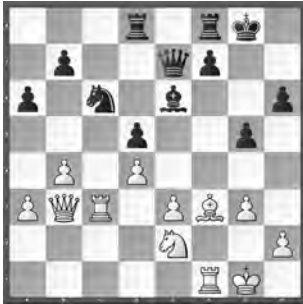
Janoszka – Wagner Meisterturnier

Welches sehenswerte Manöver nutzte Schwarz, um seine Stellung zu verbessern?