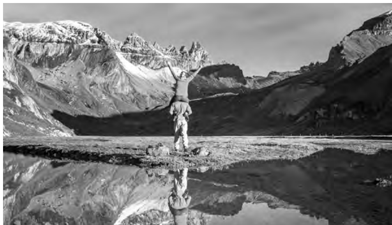
Flims werden im Juli 2020 zum dritten Mal nach 2012 und 2016 die Schweizer Einzelmeisterschaften ausgetragen.

Die Schweizer Einzelmeisterschaften finden vom 11. bis 17. Juli in Flims statt (ausser Damen- und Herren-Titeltturnier: 9. bis 17. Juli) Meisterturnier neu mit 9 Runden in 7 Tagen! (Die Ausschreibung finden Sie in «SSZ» 2/20)