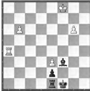
Weiss zieht und hält remis

1. g7 ♖d1. Die Verteidigung 1. ... ♖d5 zur Abwehr der Bauernumwandlung führt zu ewigem Schach: 2. ♖f4+ ♖g1 3. ♖f7 ♖xf7 4. ♖xf7 ♖f1+ 5. ♖e7 e1 ♗ 6. g8 ♗+ ♖f2 7. ♗f7+ ♖e2 8. ♗c4+ usw.