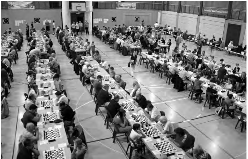
Die Schiedsrichterkommission achtet darauf, dass nur qualifizierte Schiedsrichter für SSB-Wettkämpfe (im Bild der Spielsaal der Schweizer Einzelmeisterschaften 2019 in Leukerbad) nominiert und eingesetzt werden.