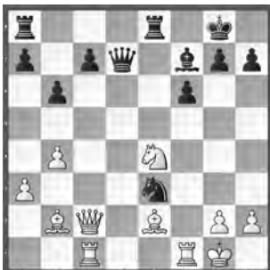
Wagner – Huss Meisterturnier

Schwarz hat für die Springergabel eine Figur geopfert. Welchen Konter hat er übersehen?