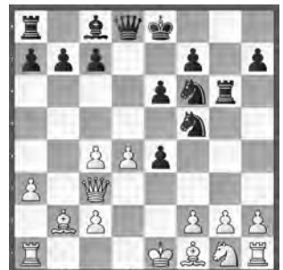
Curien – Henderson De La Fuente Meisterturnier

Wie kann Weiss entscheidenden Vorteil erringen?