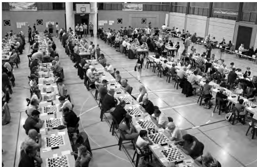
La Commission arbitrale veille à ce que seul des arbitres qualifiés soient nommés et engagés pour les compétitions de la FSE (image: la salle de tournoi du Championnat suisse individuel 2019 à Loèche-les-Bains).