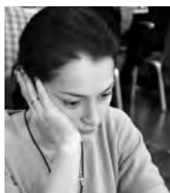
Kann GM Alexandra Kosteniuk in Lausanne ihren Sieg von Monaco wiederholen?

Star des Lausanner Turniers ist die russisch-schweizerische Doppelbürgerin GM Alexandra Kosteniuk. Nachdem sie in Skolkowo mit dem 8. Rang hatte Vorlieb nehmen müssen, gewann sie das zweite GP-Turnier in Monaco.