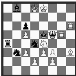
14701 Gerhard Maleika Gütersloh (De)

14694 H. Baumann. 1. Kc1? f5! 1. Ke1? f6/f5 2. Kd1!/Tb4!; 1. ... Kc2! 1. Tb4! f6 2. Tf4! f5 3. Kc1 Ke2 4. Kc2 Ke1 5. Kd3 Kd1 6. Tf1 1. ... f5 2. Ke1 f4 3. gxf4 Kc2 4. Ke2 Kc1 5. Kd3 Kd1 6. Tc1. Tempo-Duell, Tanz um das goldene Kalb rechts und links rum. Rückkehr in Verführung und Lösung (Autor). Vgl. W. Speckmann, Die Welt 1954, H. Klüver gew., W.Kd1 Ta5 Bd2h4 S.Kd3 Bh7; #5, b: nach dem Schlüssel. Auch W. Pauly hat sich mit dem Schema beschäftigt. «Eine Schachperle» (WL). «Zum Dessert eine nicht schwierige, aber feine Miniatur» (JK).