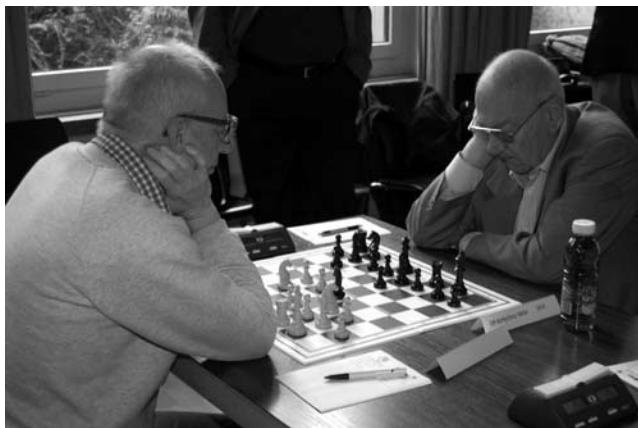
Im Schlussrunden-Match Zürich – Luzern kam es am ersten Brett wie im Final des Weltmeisterschafts-Kandidatenturniers 1980 zum Duell zwischen Viktor Kortschnoi (rechts) und Robert Hübner. Vor 28 Jahren siegte Kortschnoi 6½:3½, diesmal trennten sich die beiden nach 44 Zügen mit einem Remis.

In der 7. Nationalliga-B-Runde wurden mit St. Gallen und Rössli Reinach/BL gleiche beide Leader gestürzt. St. Gallen konnte sich seiner Führungsposition in der Ostgruppe nur gerade eine Runde lang erfreuen. Drei Wochen nachdem die Ostschweizer den Leaderthron erklommen hatten, mussten sie ihn als Folge der unerwarteten 3:5-Niederlage gegen das in Abstiegsgefahr steckende Tribtschen schon wieder abgeben. Und zwar an Bodan Kreuzlingen, denn das Bodensee-Team liess Winterthur II keine Chance (6½:1½) und etablierte sich mit einem Punkt Vorsprung auf Nimzowitsch (5½:2½-Sieg gegen Olten), Baden (4:4-Unentschieden