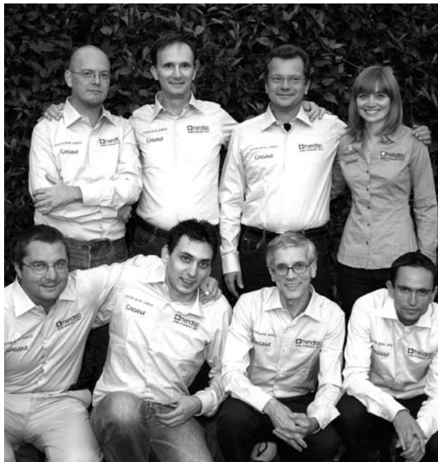
La squadra del Mendrisio partecipante alla Coppa europea dei campioni.