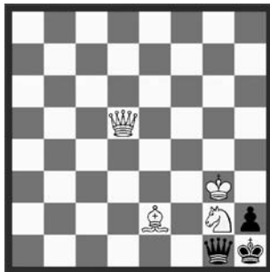
14705 Baldur Kozdon Flensburg (De)