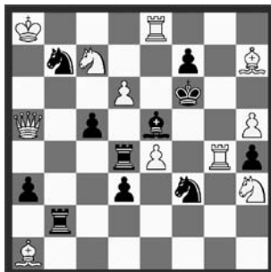
3) 16. Platz: Thomas Maeder