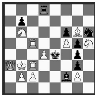
2) 17. Platz: Roland Baier