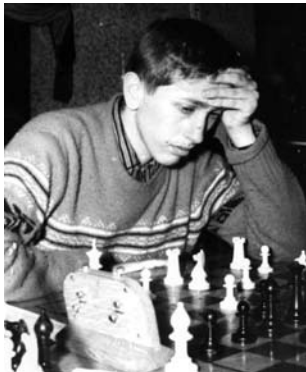
Bobby Fischer am 21. April 1959