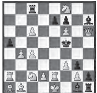
S # 3