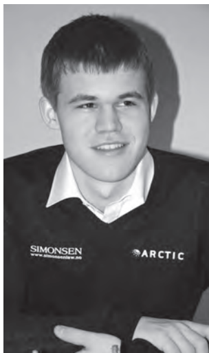
Magnus Carlsen est devenu au fil des ans le joueur universel par excellence, le navigateur qui se sent toujours à l'aise que la mer soit déchaînée ou les eaux calmes.

Un joueur comme Kramnik, en revanche, malgré tous ses efforts pour suivre le 21ème siècle et pour sacrifier des pièces à tout va reste malgré tout, à la fin, quand ça compte vraiment, un joueur typé «solide». De l'autre côté, un Mamedyarov essaie avec un certain succès de rendre son