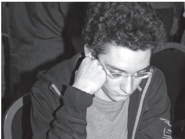
Prestigesieg in der Startrunde: GM Fabiano Caruana.