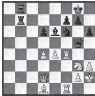
Magnus Carlsen (Nor) – Hikaru Nakamura (USA)

Ici, la position réclame d'attaquer; les Blancs sont dans une situation de supériorité numérique complète là où cela se passe et Carlsen exécute son adversaire grand style.