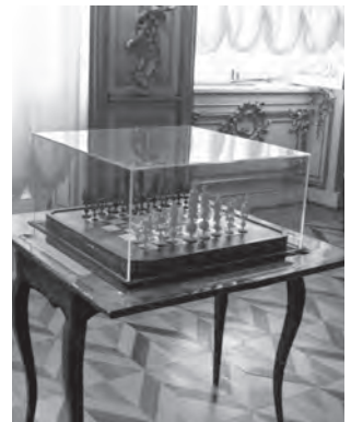
Falsch aufgestelltes Schachbrett im Katharinen-Palast in St. Petersburg.