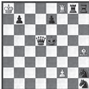
H # 3 3 Lösungen