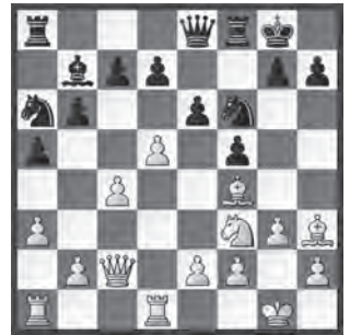
Magnus Carlsen (Nor) – Vassily Ivanchuk (Ukr)

14. ... exd5. Coup quelque part entre intéressant, courageux et provocateur. En même temps, il faut prendre des risques avec les Noirs pour gagner, donc pourquoi pas.