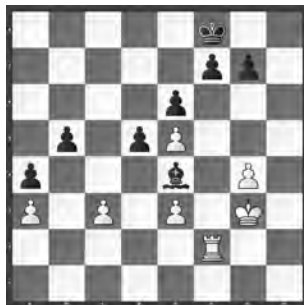
Wladimir Kramnik – Viswanathan Anand 5 th Zurich Opening Blitz

Weiss hat Schwierigkeiten, seinen Materialvorteil zu verwerten, weil sein König keinen einfachen Weg in die gegnerische Stellung findet. Aber Schwarz hat es ebenfalls nicht leicht, die Stellung remis zu halten. So wird zum Beispiel das natürliche ♕e7 raffiniert widerlegt: 41. ... ♕e7 42. g5! ♕f5 43. ♕f4 ♕d3 44. ♞h2 ♕e4 45. ♞h8 ♜d7 46. ♞g8 g6 47. ♞f8 ♕e7 48. ♞b8 ♕d3 49. ♞b7+ ♕e8 (mit zwei Hebeln wird die schwarze Burg destabilisiert) 50. e4! dxe4 51. ♕e3 ♕f8 52. ♜d4 ♕e8 53. c4! ♕xc4 54. ♞b8+! ♜d7 55. ♕xe4! ♕c6 56. ♜d4 ♕d5 57. ♞f8 mit Vorteil für Weiss. Man kann deshalb verstehen, dass der Inder den Vorstoss g4-g5 verhindern möchte.