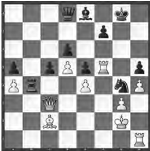
Krämer – Hort SMM 2016, Luzern – Réti

Mit welchem taktischen Trick kommt Schwarz in Vorteil?