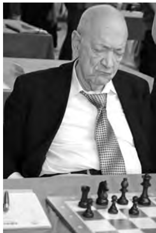
«Ein Wundersenior»: Viktor Kortschnoi (1931–2016).