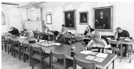
Spicken und elektronische Hilfsmittel sind bei einem Lösungsturnier wie in der Schule nicht erlaubt.

Als Aufgaben gibt es drei Zweizüger und zwei Dreizüger. Anmelden kann man sich beim Turnierleitertisch bzw. im Jugendschachlager. Um 19 Uhr stehen die Teilnehmerkontrolle und Instruktionen auf dem Programm. Um 19.15 Uhr beginnt