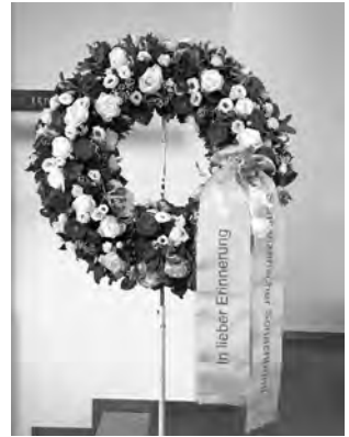
Für seine grossen Verdienste um das Schweizer Schach legte der Schweizerische Schachbund am Grab von Viktor Kortschnoi einen Kranz nieder.

40. ... ♗g7 41. ♖e3 bxc3 42. bxc3 ♗xc3 43. ♖h5 d5 44. g5 ♖a1+ 45. ♖g2 ♗f1+ 46. ♖g3 ♗e5+ 0:1. Caruana warf das Handtuch. Ein brillanter Sieg von Viktor Kortschnoi und ein Genuss für jeden Schachkenner. Absolut bemerkenswert dabei ist vor allem auch, dass Viktor Kortschnoi zu der Zeit, als die Partie