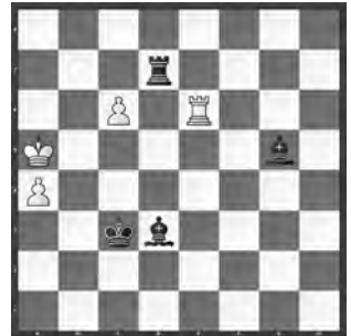
Weiss zieht und hält remis