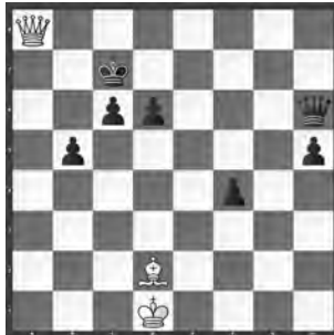
3 Kategorie 1, Runde 2 Leonid Kubbel Shakhmaty 1955 (Mirror)