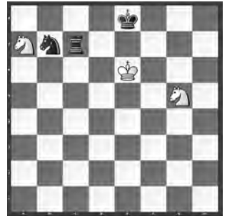
Weiss zieht und hält remis

Lösungen mit Kommentaren bis 10. August 2016 per E-Mail an roland.ott@swisschess.ch