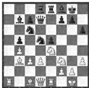
Hikaru Nakamura – Lewon Aronjan 5 th Zurich Opening Blitz

Weiss steht besser. Das Zentrum ist einigermaßen unter Kontrolle, und an den Flügeln sieht es gut aus (a-Linie, c5, f7).