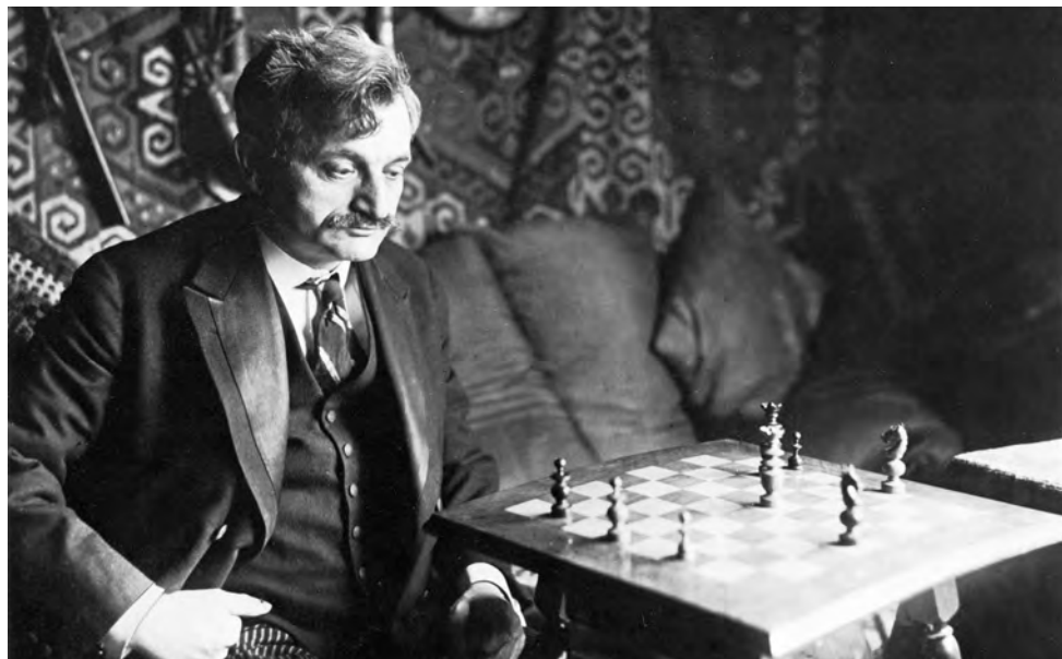
Emanuel Lasker war 27 Jahre Schachweltmeister – länger als jeder andere.