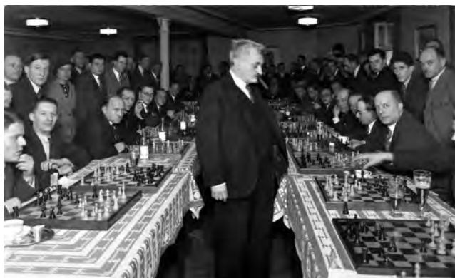
1937 spielte Emanuel Lasker auf Einladung des Zürcher Schachverbands im Hotel «St. Gotthard» 28 Partien simultan.