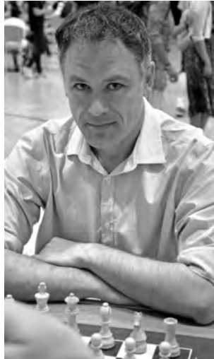
Der französische Grossmeister Christian Bauer gewann das Hauptturnier I überlegen.

1. d4 a6?! Ein provokativer Zug. Es gibt nach 1. e4 sicherlich bes-