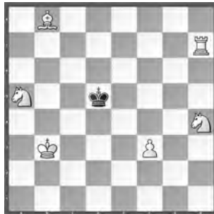
15299 Petrašin Petrašinić Belgrad (Srb)