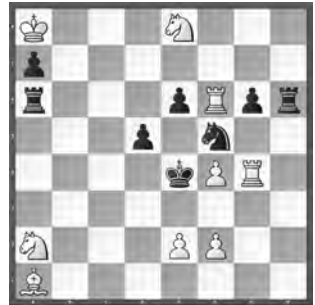
15296 Herbert Ahues Publikation post mortem