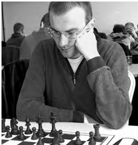
Hat seinen Nimzowitsch intus: GM Michael Prusikin.

5. ♗f3 ♕d7 6. ♕d3 ♖c6?! Der andere Plan für Schwarz besteht im Abtausch des schlechten Läufers, was allerdings Zeit kostet: 6. ... ♕b5 7. 0-0 ♕xd3 8. ♗xd3 ♗c6 9. dxc5 ♕xc5 10.