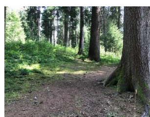
(Wald in der Nähe)