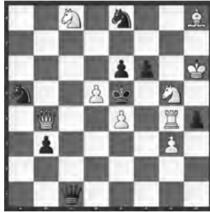
15025 Herbert Ahues Bremen (D)

15018 H. Baumann. 1. ♖c3? (2. ♖e5) e5! 2. f5 e4 3.? bzw. 2. ♖xe5+ ♗e6 3. ♗e8 d6! 1. ♖e1? (w Zzw.) e5 2. f5 b6! – 1. ♖a5! (2. ♖c7) b6! 2. ♖e1! (Zzw; 2. ♖xb6? c4) e5 3. f5 e4 (3. ... g3 4. f3) 4. f4! g3! (4. ... e/gxf3 e.p. 5. ♖g3) 5. ♖c3 (6. ♖e5) c4 6. ♖b4; 2. ... g3 3. f3! e5 4. f5 b5/g2 5. ♖a5/♖h4 6. ♖c7/♖e7 (1. ... e5 2. f5 b6 3. ♖e1! g3 [3. ... e4 4. f4] 4. f3 g2/b5 5. ♖h4/♖a5 usw.). – Temposchöpfer, w Römer, Umnow 2, Prävention gegen e.p.-Schlag, Rückkehr (Autor). «Raffiniert eingefädelte Einkesselung des s♖, die Spass zum Lösen bereitet hat» (RO). Martin Hoffmann