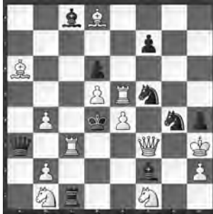
1 Lew Loschinskij und Wladimir Schif Tjidschrift 1947(-48), 2. Preis