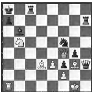
Aufgabe von Stamma 1792

Schwarz droht Matt! Doch Angriff ist die beste Verteidigung.