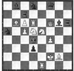
2 Anatolij Epifanov und Alexandr Kusnetzov Pobeda-50 1995, 1. Preis