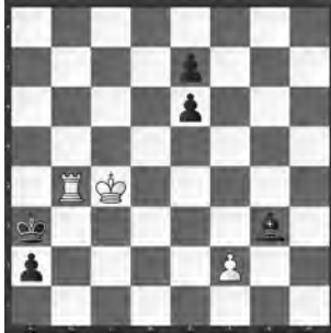
Weiss zieht und hält remis