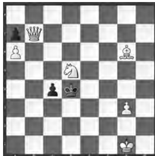
15029 Petrašin Petrašinović Belgrad (SRB)