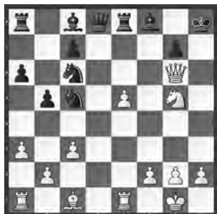
Lane – Adams London, 1993

Dunkle Wolken am schwarzen Königsflügel. Kann sich Schwarz dennoch erfolgreich verteidigen?