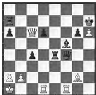
Lautier – Piket Cannes, 1990

Wie kann sich Schwarz gegen den weissen Doppelangriff zur Wehr setzen?