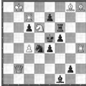
1 Roland Löwe Freie Presse 1986, 2. Preis (1. Runde)

6) 1. ♜xb7! (2. ♜e8! [3. ♜e3+]) ♜e1 2. ♜c6+ ♜e4 3. ♜xf2+! 1. ... ♜f5 2. ♜b3+ ♜xb3 3. ♜c3+ 1. ... ♜h7 2. ♜d3+! ♜xd3 3. e3, mit überraschenden Wendungen.