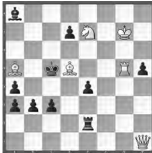
3 Miroslav Havel Stratford Express 1949 (2. Runde)