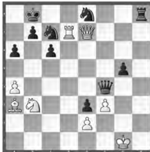
8 Philipp Stamma 1792