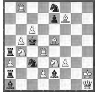
2 A. Eerkes / M. Schrader L'Echiquier Belge 1984/5 (1. Runde)