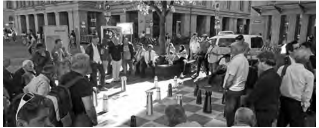
Die Stadt Bern unterhält 24 Schach- und Mühlespielplätze.

Eine Win-win-Situation, können sich die Mitarbeiter von Stadtgrün Bern so auf ihr Kerngeschäft konzentrieren. Und nebst kurzen Transportwegen kommt auch der soziale Aspekt nicht zu kurz. Dies umso mehr, als das Bemalen und Schleifen