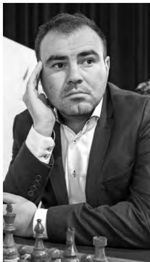
Gewann das Accentus Grossmeisterturnier überlegen: Schachrijar Mamedscharow.

Ob er denn nach seiner zweifachen WM-Titelverteidigung noch Ziele habe, wurde Magnus Carlsen in einem Tagesschau-Beitrag des Schweizer Fernsehens einen Tag vor Beginn des Bieler Schachfestivals gefragt. «Nun ja», antwortete der Weltmeister, «bei meinem letzten Auftritt in Biel wurde ich nur Zweiter, diesmal will ich gewinnen.»