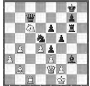
Bischofberger – Arcuti Hauptturnier I

Wie kann Schwarz seinen Angriff durchführen?