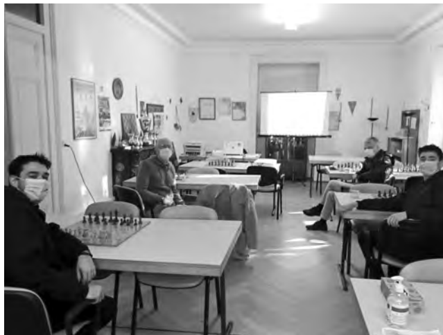
Cours d'échecs au CE Genève en temps de pandémie.

Oui, nous sommes à nouveau en standby. Notre prochain tournoi