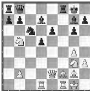
Blübaum – Parvanyan

Die weiße Stellung sieht gut aus, doch wie kann man Schwarz sofort den K.o.-Schlag verpassen?