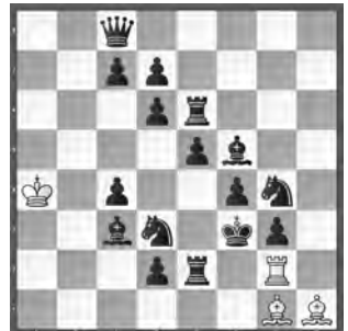
6 Alain C. White Pittsburgh Gazette Times 1916