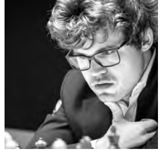
Première défaite après 125 parties en cadence classique: Magnus Carlsen.

♖f3+ 56. ♖b4 ♖f8+ 57. ♖a5 ♖f5+ 58. ♖xa6 g5 59. a5 h3 60. ♖e7+ ♖g6 61. ♖g7+ ♖h5 62. ♖h7+ ♖g4 63. ♖e4+ 1-0.