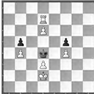
3 Wolfgang Pauly Deutsche Schachblätter 1916