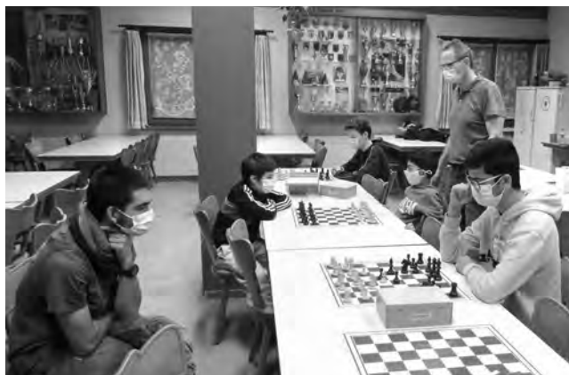
Auch im Lokal des Schachclubs Therwil gilt selbstverständlich Maskenpflicht.