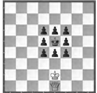
4 Pierre-Antoine Cathignol Diagrammes 1981