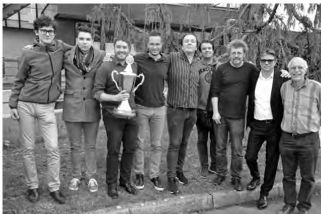
En raison de la pandémie de coronavirus, le CE Genève n'a pas pu défendre son titre de champion suisse par équipes.

A priori, on peut croire que nous avons fait des économies. Mais quels seront les effets de la pandémie à plus long terme? Nous ne le savons pas encore. Et nos membres vont-ils perdre le goût des échecs en présentiel? Nous n'avons pas de réponses à ces