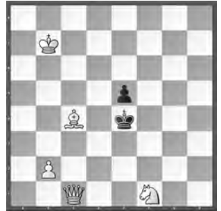
15242 Petrašin Petrašinović Belgrad (Srb)