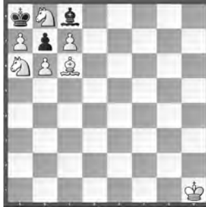
1 Samuel Loyd International Chess Magazine 1885

Leider wurden in «SSZ» 4/20 in der Nr. 2 von Åkerblom weitere Lösungen unter schlagen, wie Maurice Gisler herausgefunden hat – nämlich: 1. ... f5 ♗f2 2. ~ ♗h6 matt und 1. ... f6 ♗f3 2. f5 ♗h6 matt. Was aber nicht geht ist, dass Weiss anzieht, da er zuletzt gezogen haben muss!