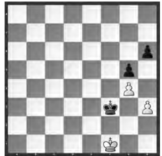
Khrapko – Hryzlova

Gibt es noch Hoffnung in diesem Bauernendspiel für Weiss?