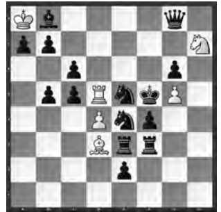
Hilfsmatt in 2 Zügen; 4 Lösungen

Eine der überraschend zahlreichen Aufgaben schweizerischer Herkunft war dieses moderne Hilfsmatt mit zwei sich thematisch entsprechenden Lösungspaaren. Im Hilfsmatt zieht Schwarz an.