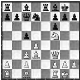
Monpeurt – D. Peglau

Weiss besitzt eine attraktive Position. Wie würden Sie hier fortsetzen?