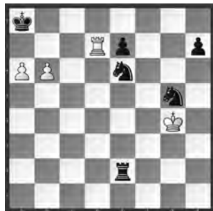
Weiss zieht und hält remis

Gegen die schwarze Übermacht kann sich Weiss nur retten, wenn es ihm gelingt, dank den beiden weit vorgerückten Freibauern eine Pattstellung zu erreichen. Denn 1. ♖xe7? scheitert an 1. ... h5+ 2. ♗h4 ♚e4+! 3. ♗g3 h4+ 4. ♗f2 ♚c5 – und nicht 2. ... ♗f3+? wie Votrubas Lösung von 1929 lautete, die in der Problemdatenbank yacpdb aufgeführt ist: www.yacpdb.org/#294208.