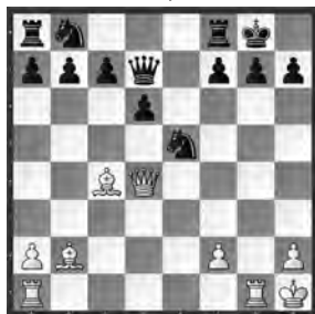
Hartlaub – Testa Bremen, 1913

Weiss am Zug! Kombinieren Sie bis zum Matt!