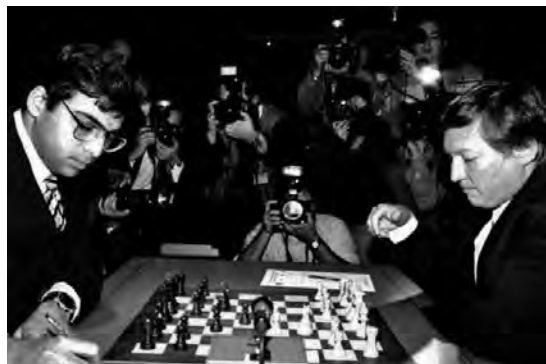
Anatoly Karpov (à droite) a défendu son titre de champion du monde contre Viswanathan Anand à Lausanne.

23. ♖b5+ ♗cd7 24. ♖xb7 ♗xc2 25. ♙g5 ♖d6 26. ♖a8+