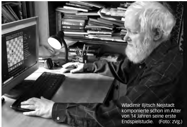
Wladimir Iljitsch Nejstadt komponierte schon im Alter von 14 Jahren seine erste Endspielstudie.

Lösungen mit Kommentaren bis 10. Februar 2025 per E-Mail an roland.ott@swisschess.ch