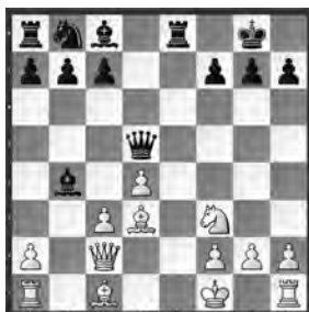
Janowski – Marshall Vilno, 1912

Frank Marshall war ein gefürchteter Angriffsspieler. Was führte er hier mit Schwarz im Schilde?