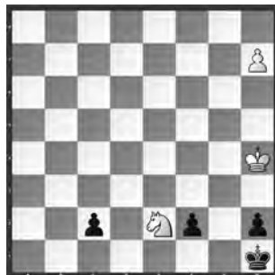
Weiss zieht und gewinnt

Ehrende Erwähnung, «Seven Chess Notes» 2023