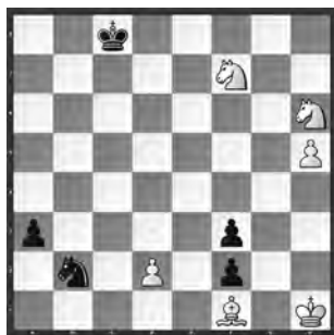
Weiss zieht und gewinnt

Obwohl Weiss mit zwei Leichtfiguren im Vorteil ist, ist der Sieg alles andere als klar, weil der schwarze Freibauer nur noch zwei Züge vor der Umwandlung in eine Dame steht.