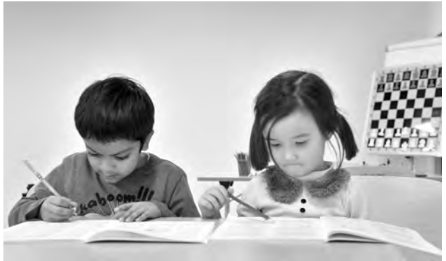
Unter den Fittichen von Chess4Kids stehen 230 Kinder.