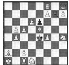
Michel Caillaud Thèmes 64 1979

1. ♚g8! (Zzw.) ♚g6 2. ♚g7! – 3. ♜a8 1. ... ♚g5 2. ♚g6! –/♚xe5 3. ♜a8/♜xe5 1. ... ♚g4 2. ♚g5! – 3. ♜a8 1. ... ♚g3 2. ♚g4! (3. ♜a8) ♚–3 3. f5 1. ... ♚g2 2. ♚g3! (3. ♜a8) ♚xc2, ♚d2 3. ♚e3 1. ... ♚g1 2. ♚g2! (1. ... ♚xg8 2. ♚b1! [3. c4] ♚g2, 3 3. ♜a8). Interessant ist auch die Opfer-Verräumung des ♚ im Schlüsselzug.