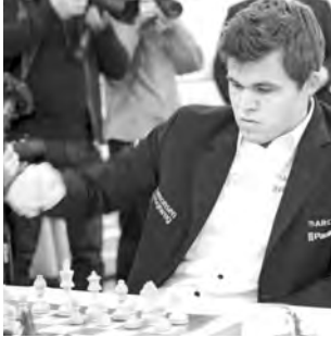
A Shamkir Magnus Carlsen n'a pas hésité à montrer sa déception lors du tirage au sort.