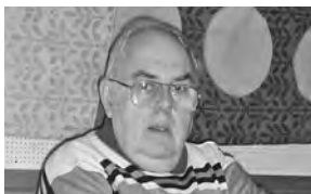
IM Charles Partos (1936–2015).

ma. Im Alter von 78 Jahren verstarb in Basel der Internationale Meister Charles Partos. Der gebürtige Rumäne, der 1977 anlässlich einer Vorrunde der Europa-Mannschaftsmeisterschaft in die Schweiz emigriert war, gehörte in den 80er-Jahren er zu den stärksten Schweizer Spielern.