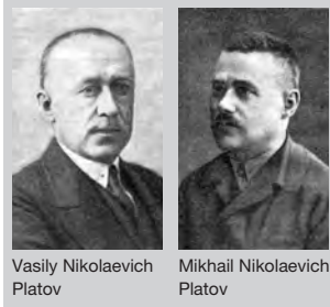
Vasily Nikolaevich Platov