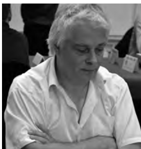
Beat Züger (1961–2023) gewann als einziger Spieler alle nationalen Titel.

ma. Die Schweizer Schachszene trauert um eine grosse Persönlichkeit. Im Alter von 62 Jahren verstarb nach längerer Krankheit Beat Züger. Der aus Siebnen stammende Schweizer war der einzige Spieler, der alle nationalen Titel holte: 1978 wurde er Schweizer Juniorenmeister, 1989 Schweizer Meister, 1978 Coupe-Suisse-Sieger, 1978, 1987 (jeweils mit Zürich) und 1991 (mit Luzern) Schweizer Mannschaftsmeister, 1995 (mit Grischuna) Team-Cup-Sieger. 1983 gewann er zudem das Jungmeisterturnier in Zug und 1987 das Credit Suisse World Mixed in Biel.