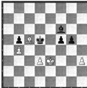
B. Huss – Wirthensohn Senioren-Titeltturnier

Zur Abwechslung ein Endspiel. Wie gewinnt hier Schwarz?