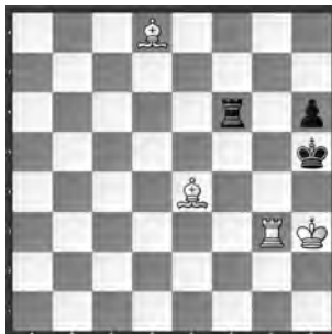
# 5 b) ♠e4→d5 (#7) 4+3