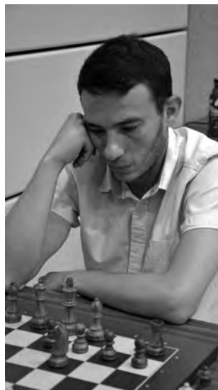
Il FM Aurelio Colmenares si è classificato al decimo rango nel torneo chiuso maschile.

► Domenica 8 ottobre ritorna inoltre a Bissone, presso l'albergo «Campione», il III Festival Semilampo organizzato dalle Aquile di Lugano (David Campionovo) che in novembre, dal 17 al 19 novembre riproporranno presso l'Hotel «Villa Sassa» l' Open di Lugano .