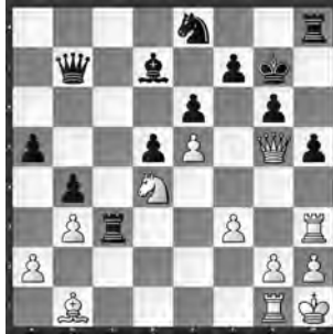
Stoeri – Sedina Damen-Titeltturnier

Wie erstürmen Sie hier mit Weiss die schwarze Königsfestung?