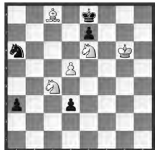
# 7 5+5